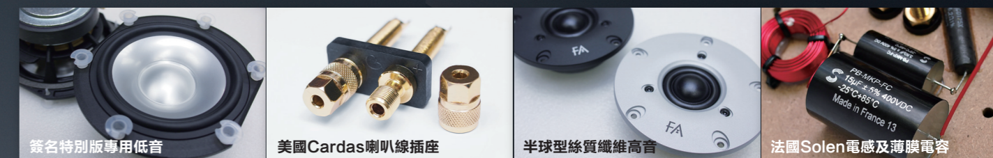
簽名特別版專用低音